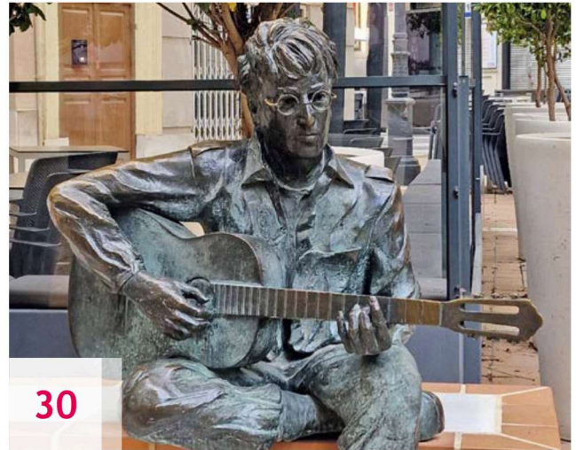
John Lennon en Almería